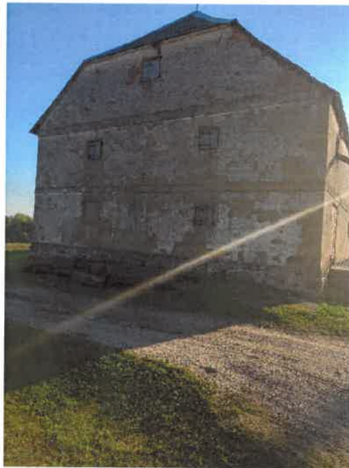
Nr.1. Vakarinė pastato siena