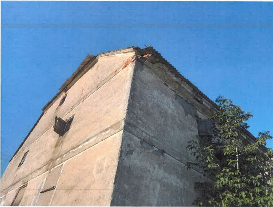
Nr.5. Blogēja ŠR pastato stogo dalis. Iš šiaurinės pastato pusės auga keletas medžio atžalų, kurias būtina pašalinti.