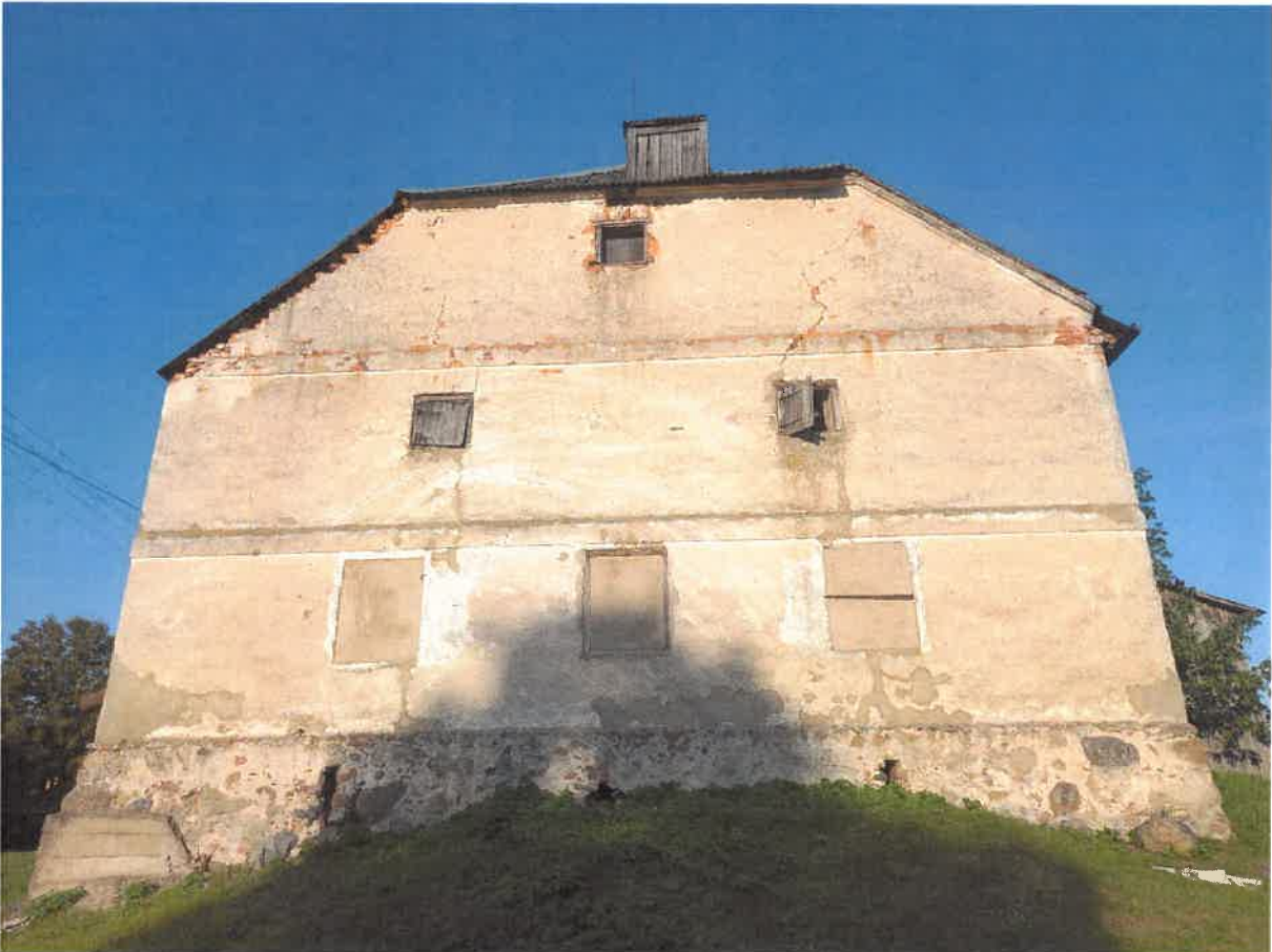
Nr.4. Blogėja pastato sienų konstrukcija, stipriai įskilusi rytinė pastato siena