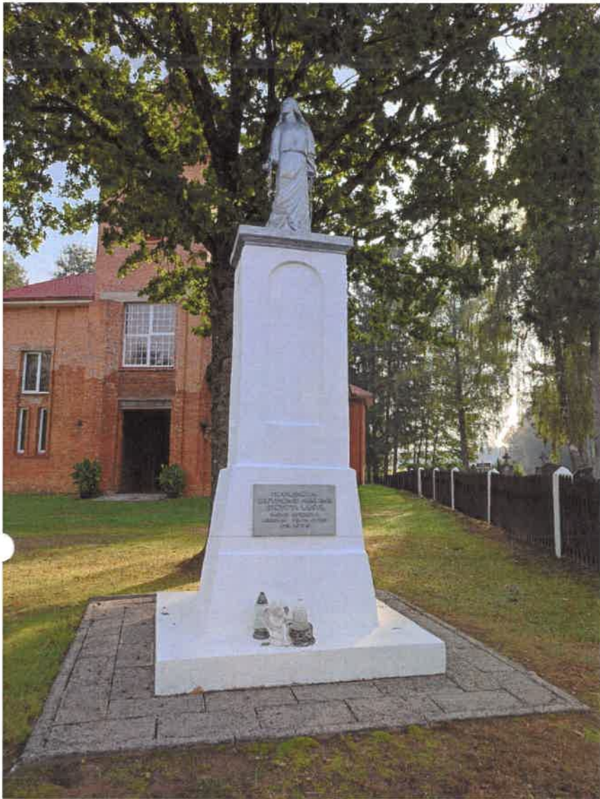
Nr.1. Paminklas perdažytas 2024 m.