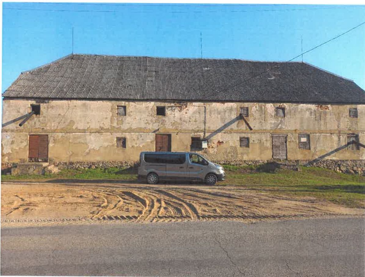
Nr.2. Pietinė pastato siena